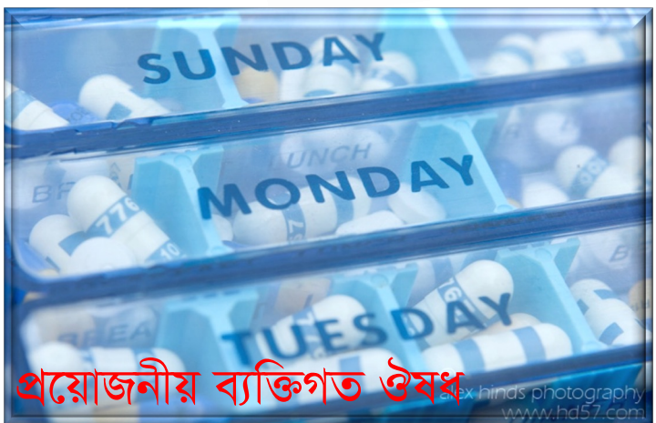
প্রয়োজনীয় ব্যক্তিগত ঔষধ প্রেসক্রিপসন সহ (পুরো সফর হিসাব করে)