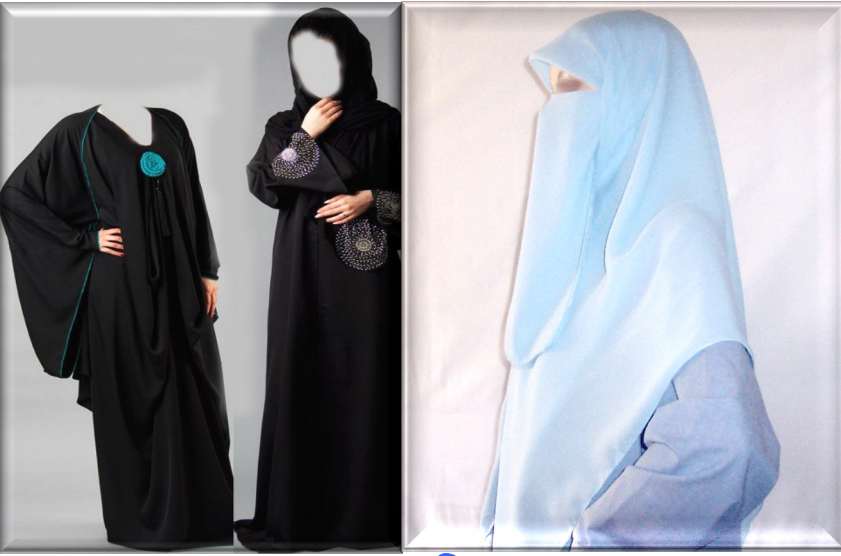
বোরকা/ বড় হিজাব