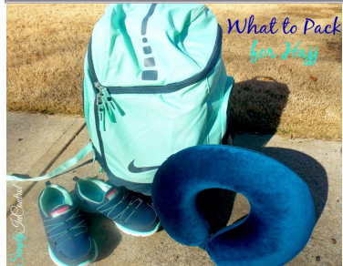
চামড়া/স্পঞ্জের নরম এবং আরামদায়ক স্যান্ডেল/কেডস