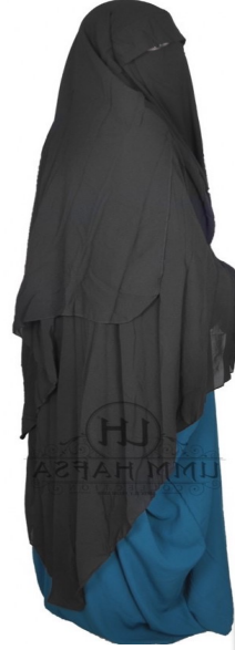
গ্রুপে একই রঙের মাথার হিজাব