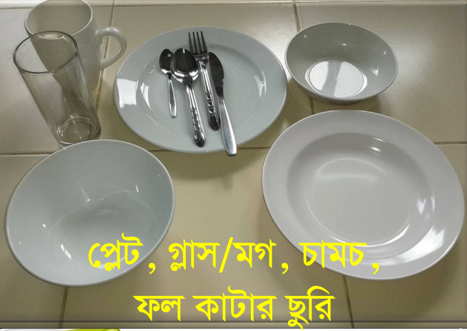
প্লেট, গ্লাস/মগ, চামচ, ফল কাটার ছুরি